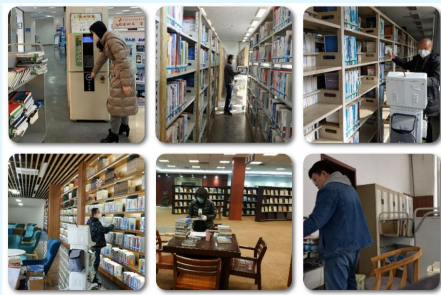
图2 电子科技大学图书馆开展馆舍消毒