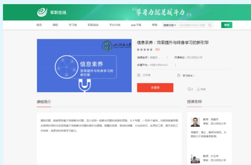
图 10 四川师范大学图书馆慕课《信息素养：效率提升与终身学习的新引擎》

四川大学图书馆在继续做好“一小时讲座”和院系定制化信息素养培训的同时，面向全校开设《信息检索与利用》课程，本学期共有 1290 名本科生选课，2 月 24 日正式开始利用 QQ 群课堂进行线上教学。老师们认真准备、认真授课，线上答疑、线上指导作业一丝不苟，同学们听课热情高涨，积极进行实践操作、认真完成作业。