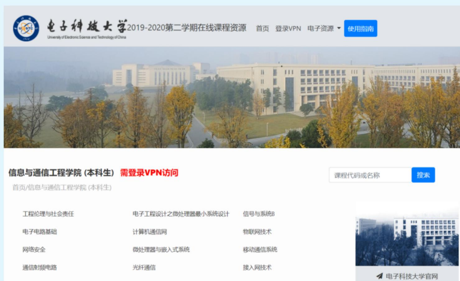
图9 电子科技大学 2019-2020 第二学期在线课程资源平台

达到 25 万人次。教材电子图书的建设为学校 38 个教学单位（32 个学院、6 个其他教学机构）开展网络教学工作提供了坚实的文献资源支撑。同时，在加大已购买电子图书推荐服务和初步建设的教材教参选荐用平台的基础上，快速开通包含剑桥大学出版社精品教材、国际知名出版社德古意特（De Gruyter）经典教材、中华数字书苑、圣智（CEB Library）电子教参数据库、人民卫生出版社“人卫临床知识库”等 6 个电子书试用平台，直接服务人才培养第一线。