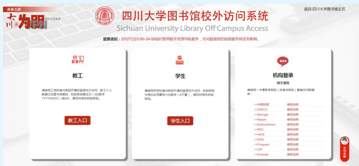
图4 四川大学图书馆全新改版优化“大川为朋（VPN）”服务平台

四川大学、电子科技大学等高校图书馆在 CARS1 联盟的技术支持下完成机构登录的调试和开通，拓展中国知网、WOS、Elsevier、Springer 等国内外文献数据库的校外使用方式，为广大师生使用数字资源提供更加便利、顺畅的服务。