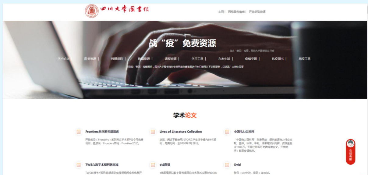
图6 四川大学图书馆战“疫”免费资源合集

馆不停服务—图书馆全天候网络学习资源免费开放”网上资源学习平台，阿坝师范学院图书馆发布“‘抗疫情’免费资源汇集”等，为师生提供了丰富的文献资源服务。