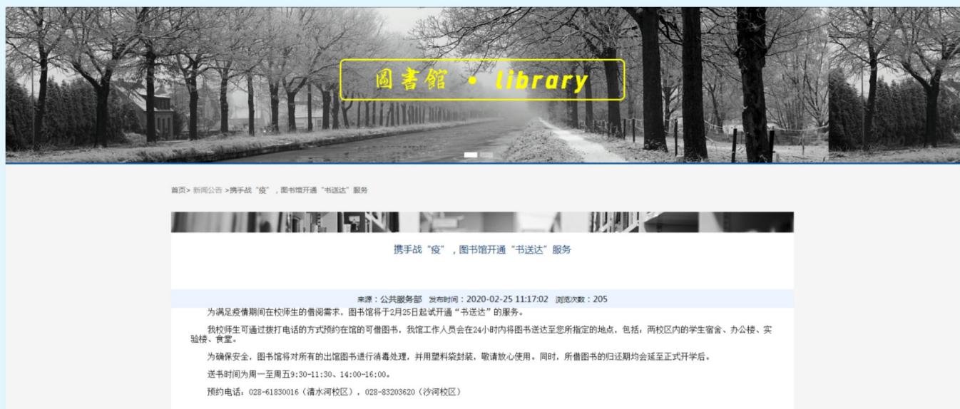
图3 电子科技大学图书馆试运行“书送达”服务

拨打电话的方式，预约在馆可借图书，工作人员在 24 小时内将图书送达至读者指定的地点，为确保安全，图书馆对所有出馆图书进行消毒处理，并用塑料袋封装。