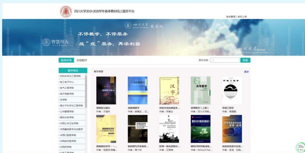
图8 四川大学图书馆电子教材线上服务

季学期教学工作的具体安排，为切实保障“停课不停学”的在线教学工作，全省高校图书馆立即行动起来，迅速采取多种管理服务措施，全力支持和保障全校在线教学活动顺利进行。