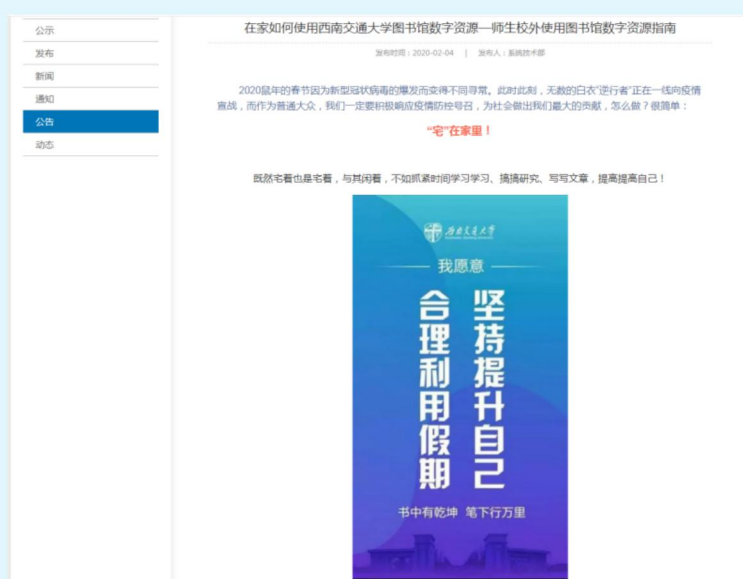
图5 西南交通大学图书馆师生校外使用图书馆数字资源指南

进行充分的准备和筹划，从硬件系统保障、应用服务保障、资源访问、远程监测、协调配合和网络咨询服务等方面进行周密的人员安排。1月28日至2月26日，四川大学图书馆主页访问超过22万人次，页面访问次数超过100万次；2月16日至25日，电子科技大学图书馆主页访问超过10万人次。